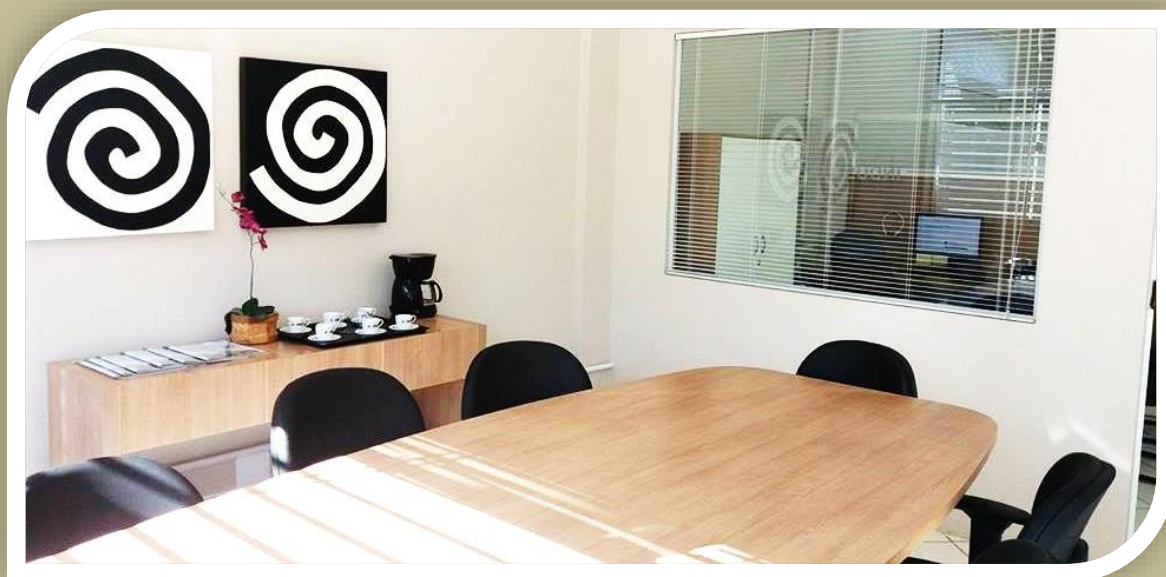
SALA DE REUNIÕES