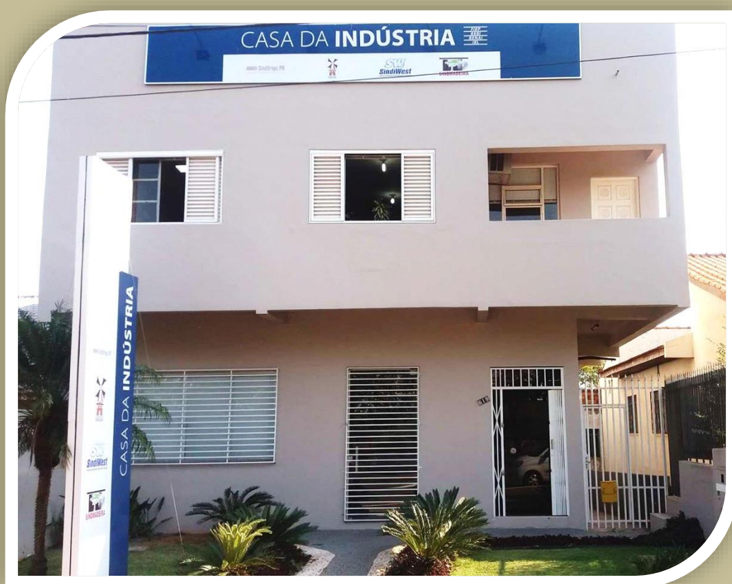
FACHADA DA SEDE