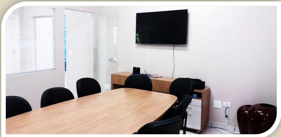
SALA DE VÍDEO CONFERÊNCIA