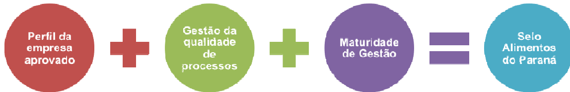
Figura 1 – Requisitos para a Concessão do Selo Alimentos do Paraná

A avaliação irá contemplar três aspectos (Figura 1) e fará uso de instrumentos diferentes em cada etapa, como detalhado adiante.