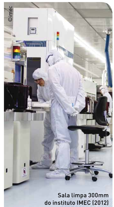
Sala limpa 300mm do instituto IMEC (2012)

Flandres (Bélgica) está situada no encontro de três importantes culturas: a cultura germânica, a romana e a anglo-saxã. Isso faz com que os habitantes da região sejam abertos e receptivos a todo tipo de influência: cultural, culinária, social e profissional. Além disso, as cidades empresariais internacionais como Antuérpia ou Bruxelas, possuem uma próspera cultura de comunidades expatriadas originária dos quatro cantos do mundo. “Tudo isso faz com que Flandres (Bélgica) seja um mercado de teste ideal para inovações”, diz Hessel de Jong, diretor-geral das operações de Benelux da Coca-Cola. “Se funciona na Bélgica, com certeza, também funcionará em qualquer lugar.”